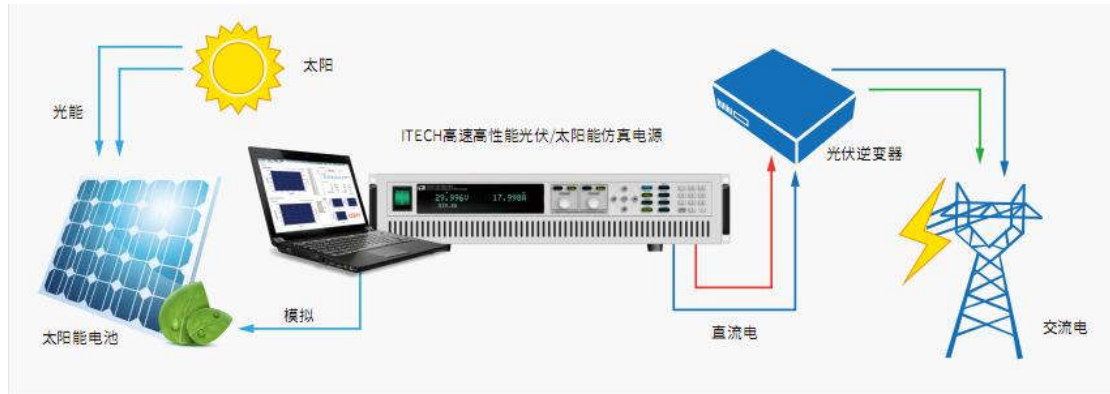
图一、利用 IT6500C 搭配专业软件测试光伏逆变器

太阳能电池矩阵的 I-V 曲线，电压最高可达 1000V，功率可扩展至 100KW。具有测量精准、稳定性高、响应速度快等特性。